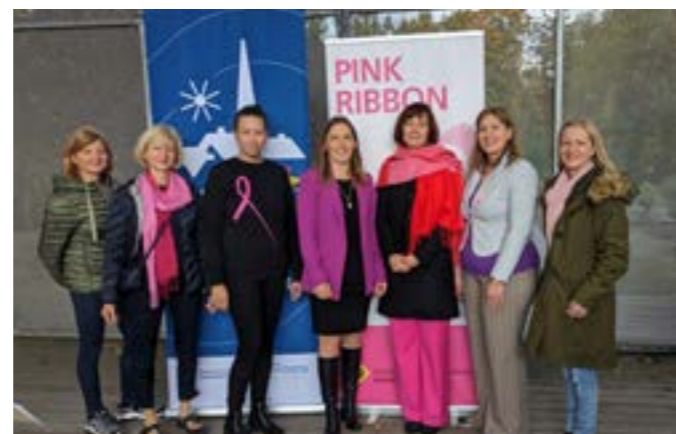
Bericht: Dr. Ute Seper

Unsere Gemeinde bietet beste Voraussetzungen, die Bewegung und damit die Gesundheit unserer Bürgerinnen und Bürger nachhaltig zu fördern. Schön, wenn wir Sie dabei unterstützen können, selbst für Ihre Gesundheit aktiv zu werden!