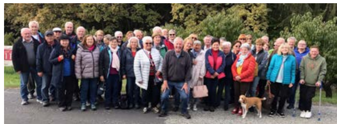
Der Ausflug zum Moor fand bei der Pensionisten-Ortsgruppe großen Anklang

Der Ortsschitag findet voraussichtlich am 3.2.2024 am Klippitztörl statt. Details wie Mindestteilnehmeranzahl und Kosten folgen vom Schiklub.