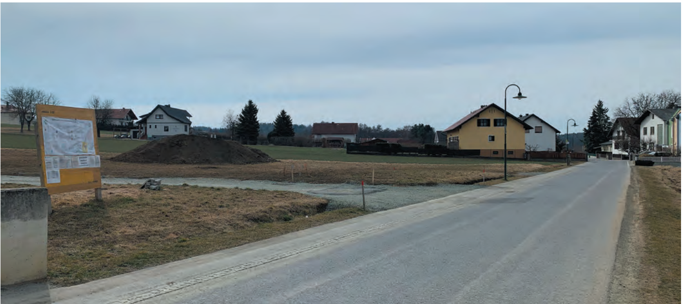
Kreuzungsbereich Sepp Rehling Gasse - Hofgasse