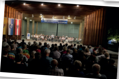
Die gut besuchte Bühne am Joseph Haydn-Platz