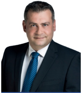
Laimer Stefan Bürgermeister