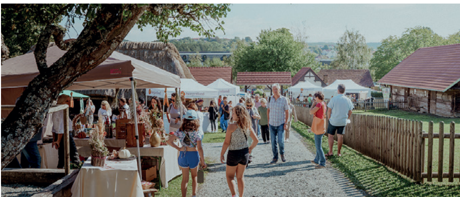
BN: Reduce Gesundheitsresort Bad Tatzmannsdorf