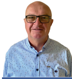
Kamer Ernst Gemeinderat