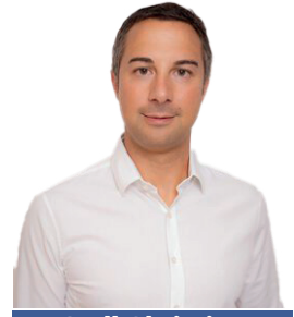
Sodl Christian Gemeinderat