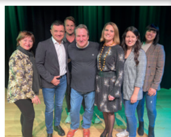
Robert Palfrader sorgte für viele Lacher