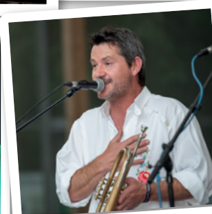
Ein Sommer voller Blasmusik