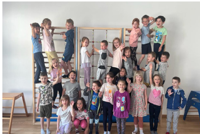
Bericht & Bilder KIGA-Team

Im Sommer verabschiedeten sich 25 Kindergartenkinder, die am 4. September stolz und mit Freude in die Schule starten. Das gesamte Kindergarten team wünscht allen Tafelklässlern alles, alles Gute und viel Spaß in der Schule. Es war schön, euch ein Stück auf eurem Lebensweg begleiten zu dürfen. Danke für die schöne Zeit mit euch!