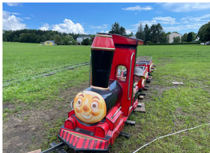
Bericht und Bilder: Simon Tourismus GmbH

Für viele Leute war der Anna Kirtag – benannt nach der Heiligen Anna, der Schutzpatronin der Jormannsdorfer Kirche – ein beliebter Höhepunkt der Veranstaltungen im Sommer.